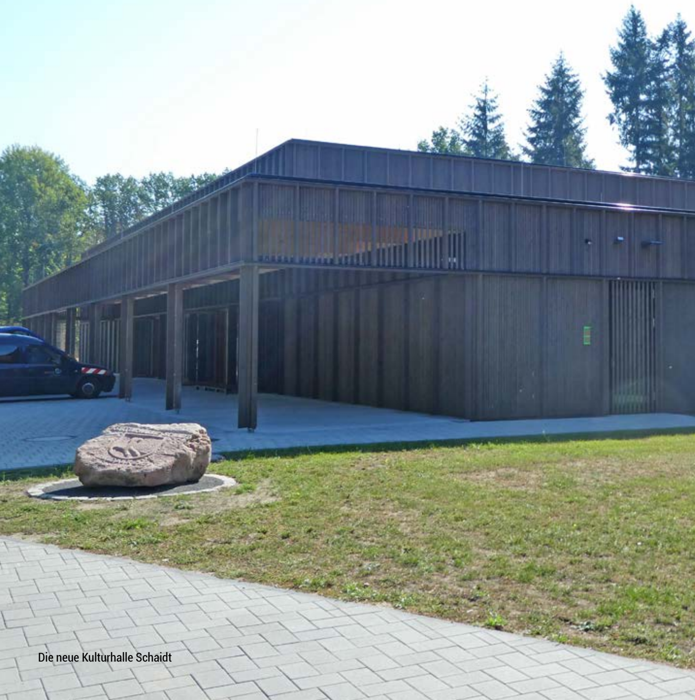
Die neue Kulturhalle Schaidt