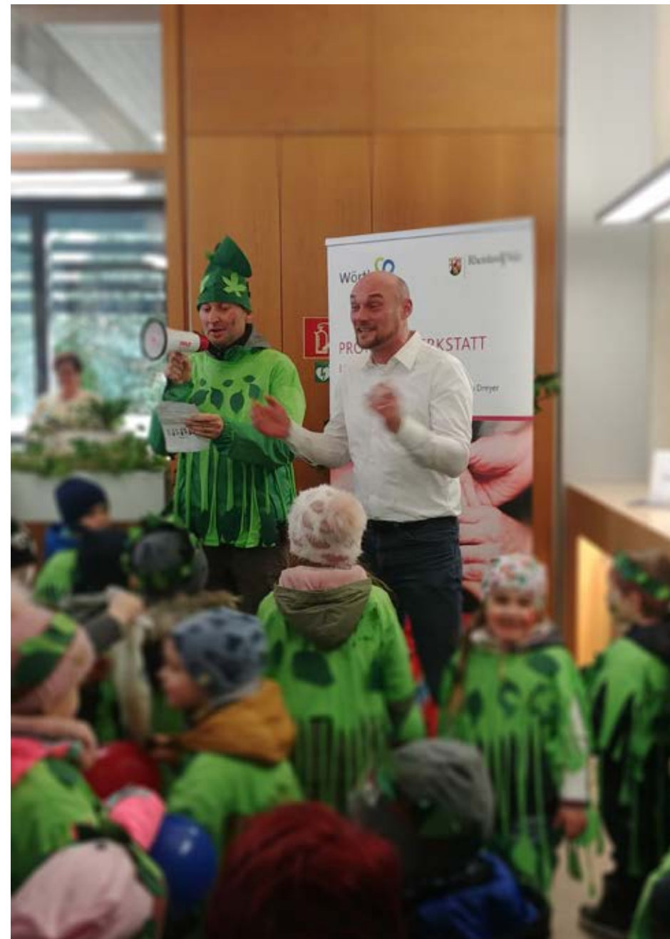
Rathaussturm mit kleinen Narren

im Baugebiet Abtswald C befindet sich im Bau. Insgesamt konnten 12 zusätzliche Kita-Gruppen geschaffen werden. Leider kann die Stadt die beiden Gruppen im Tiefparterre der Friedenskirche ab Sommer 2021 nicht weiterführen, da die Kirchengemeinde den Platz selbst benötigt. Darüber hinaus werden voraussichtlich ab Herbst 2021 erstmals seit vielen Jahren auch wieder Betreuungsangebote für unter 2-jährige Kinder in Kindertagesstätten angeboten werden können! Die Stadt Wörth ist die erste und einzige Kommune im gesamten Landkreis, die dies anbieten kann. Dafür habe ich lange gekämpft.