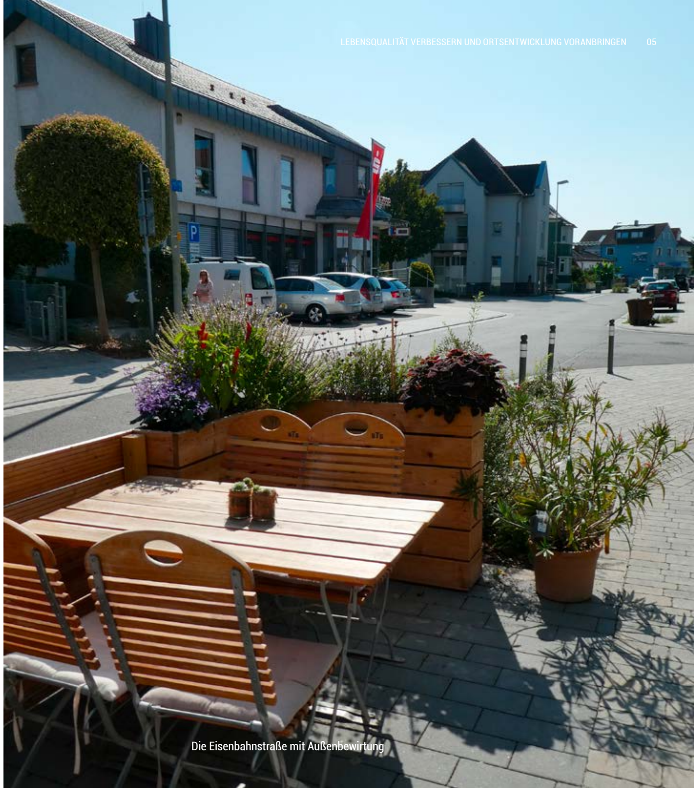
Die Eisenbahnstraße mit Außenbewirtung

In den vergangenen Jahren wurden für wichtige Bereiche unserer Stadt Entwicklungskonzepte erarbeitet, viele davon unter Beteiligung der Bürgerinnen und Bürger.