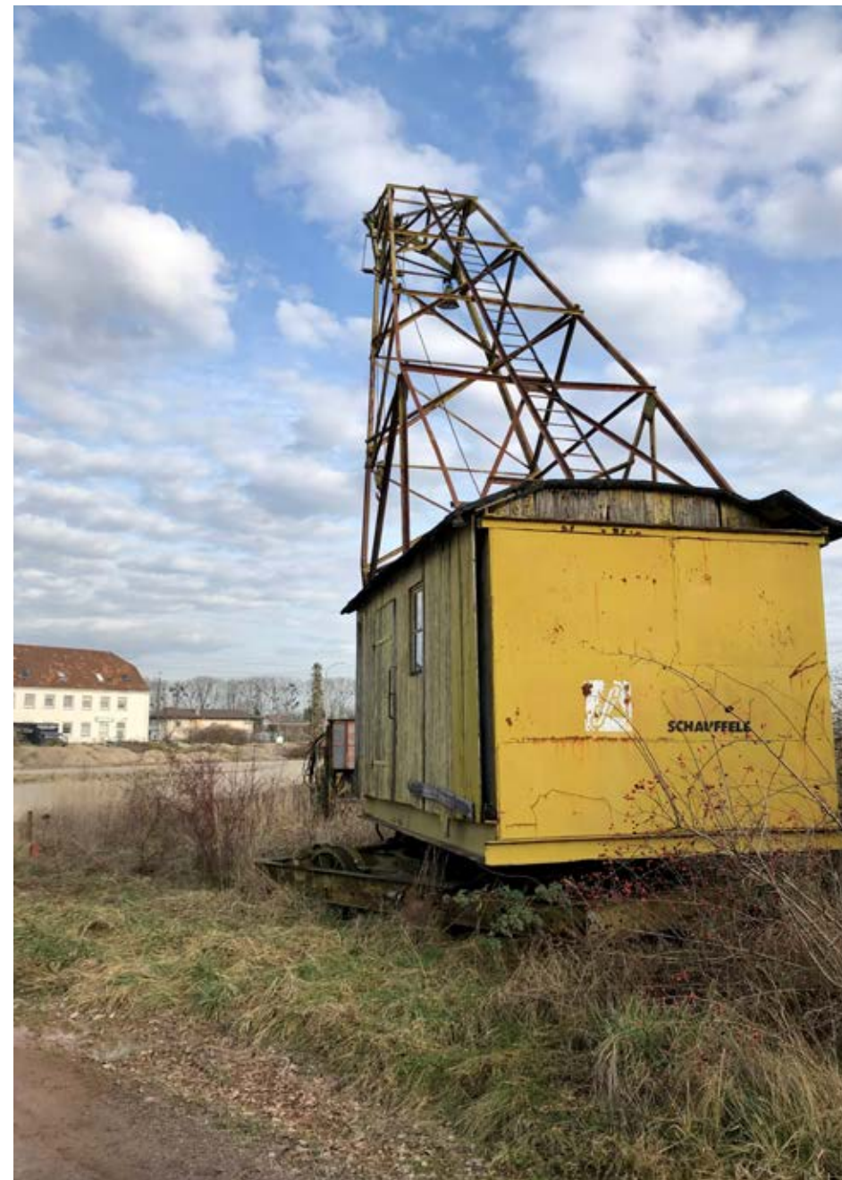
Blick auf das Schauffele-Gelände