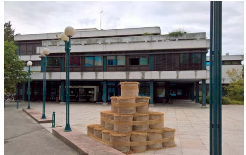
Heuballen von Öko-Wiesen im Stadtgebiet vor dem Rathaus