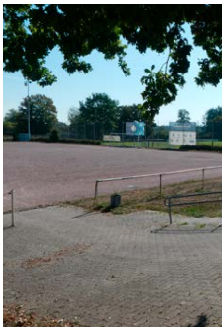
Sportplatz Büchelberg - eine Lösung ist in Vorbereitung

In einem aufwändigen Prozess unter Beteiligung der Vereine wurde ein Konzept zur Entwicklung umfassender Sportstätten auf dem Schauffele-Gelände entwickelt. Derzeit laufen die erforderlichen Verfahrensschritte, die Altlastensanierung, die Anlage von ökologischen Schutzbereichen, die Erstellung von Flächennutzungsplänen und Bebauungsplänen wie geplant. Der Abriss von Altanlagen ist bereits fortgeschritten. Die neuen Sportstätten auf dem Schauffele-Gelände werden die Vereine nachhaltig stärken.