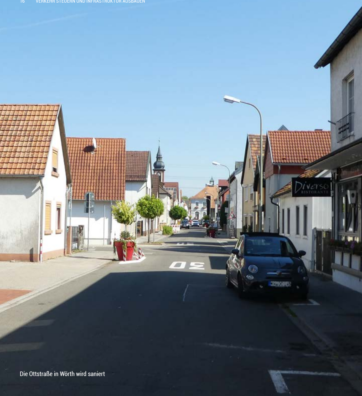
Die Ottstraße in Würth wird saniert