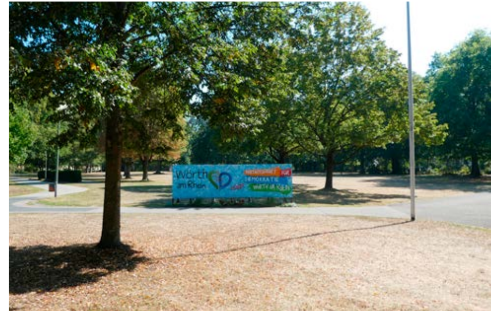
„Demokratie leben!“ - und Bürgerpark attraktiver gestalten

politischen Parteien im Stadtrat stets gleichberechtigt einbezogen – für mich ein Gebot der Fairness. Rückmeldungen auf Bürgeranfragen an mich persönlich erfolgen in der Regel spätestens binnen drei Werktagen – häufig sogar noch am Tag der Anfrage. Darüber hinaus berichte ich dem Stadtrat regelmäßig über Projekte, an denen die Verwaltung arbeitet – schon lange, bevor der Stadtrat dazu Entscheidungsvorlagen vorgelegt bekommt. Alle Nachfragen von Stadtratsfraktionen werden selbstverständlich vollständig beantwortet.