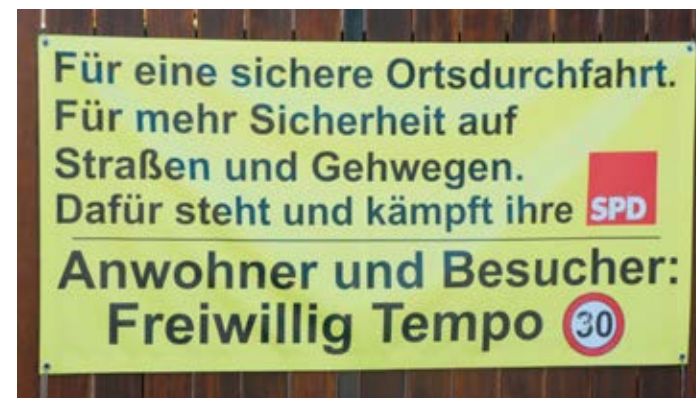
Die Abstufung der L540 ermöglicht die Sanierung und Umgestaltung

Die Stadt Wörth sichert die Lebensgrundlagen der Bürgerinnen und Bürger, beispielsweise durch die Sanierung des Wasserturms Büchelberg (Wasserzweckverband Bienwald). Die Sanierung des Wasserwerks Schaidt ist für 2021 vorbereitet.